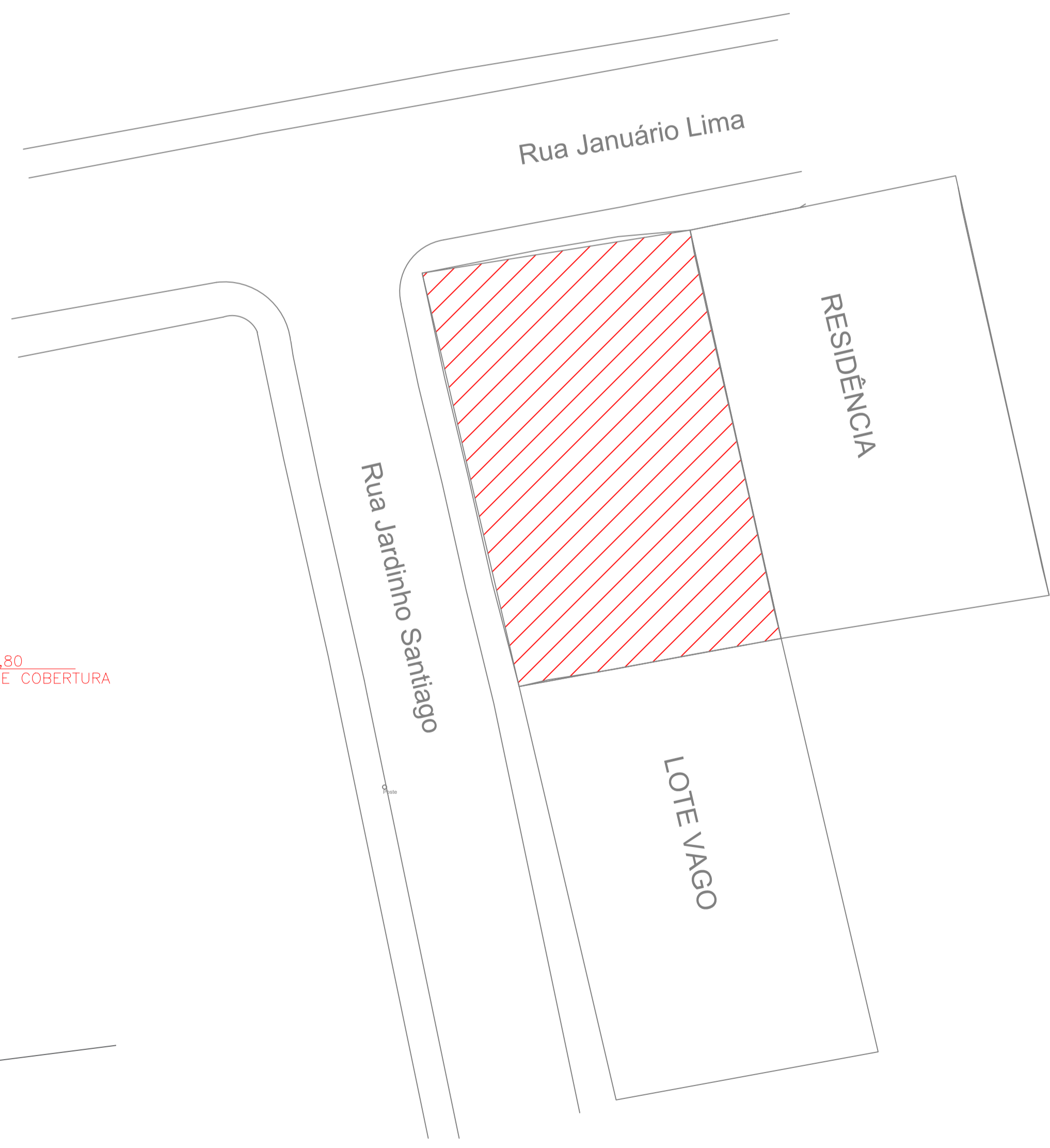
5 PLANTA LOCALIZAÇÃO ESCALA 1/200